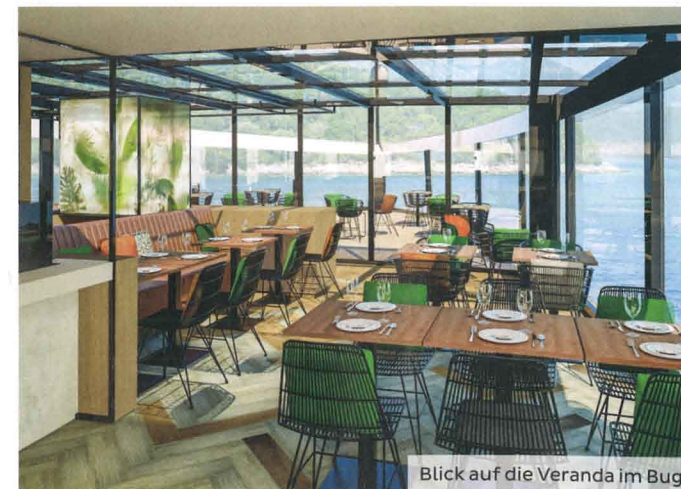
Blick auf die Veranda im Bug

Die Bordwährung ist Euro. Sie können am Ende der Kreuzfahrt Ihre Rechnung sowie an Bord gebuchte Ausflüge bequem bar, mit Ihrer EC-Karte (PIN-Nummer erforderlich) oder mit Ihrer Kreditkarte (Mastercard, VISA) bezahlen.