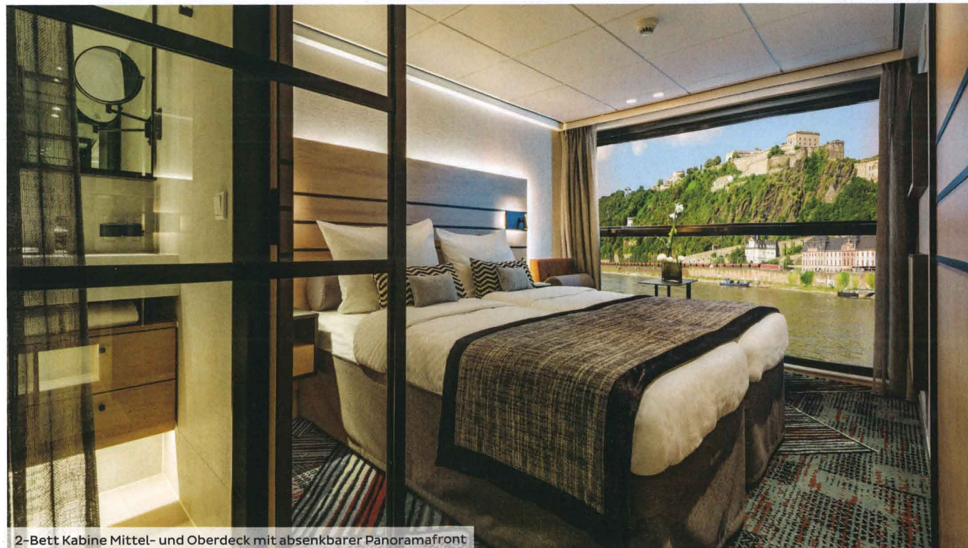
2-Bett Kabine Mittel- und Oberdeck mit absenkbarer Panoramafont

Sie wünschen sich ein Schiff mit einem neuen An-Bord-Konzept und innovativem Design? Willkommen an Bord unserer nickoSPIRIT. Das neueste Schiff unserer Flotte mit der idealen Größe für Kreuzfahrten auf Rhein, Main & Mosel vereint alles, was der moderne Kreuzfahrer begehrt: Spontanes Genießen in einem der drei Restaurants, lichtdurchflutetes Interieur gepaart mit viel Raum für Individualität sowie moderne Kabinen mit absenkbarer Panoramafont. Auch Entspannung und Wohlfühlen kommen nicht zu kurz im großzügigen Wellness- und Fitness-Bereich mit Sauna und Whirlpool.