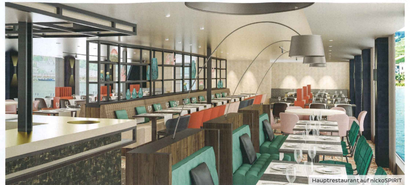
Hauptrestaurant auf nickoSPIRIT