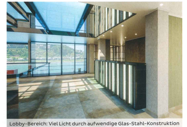
Lobby-Bereich: Viel Licht durch aufwendige Glas-Stahl-Konstruktion