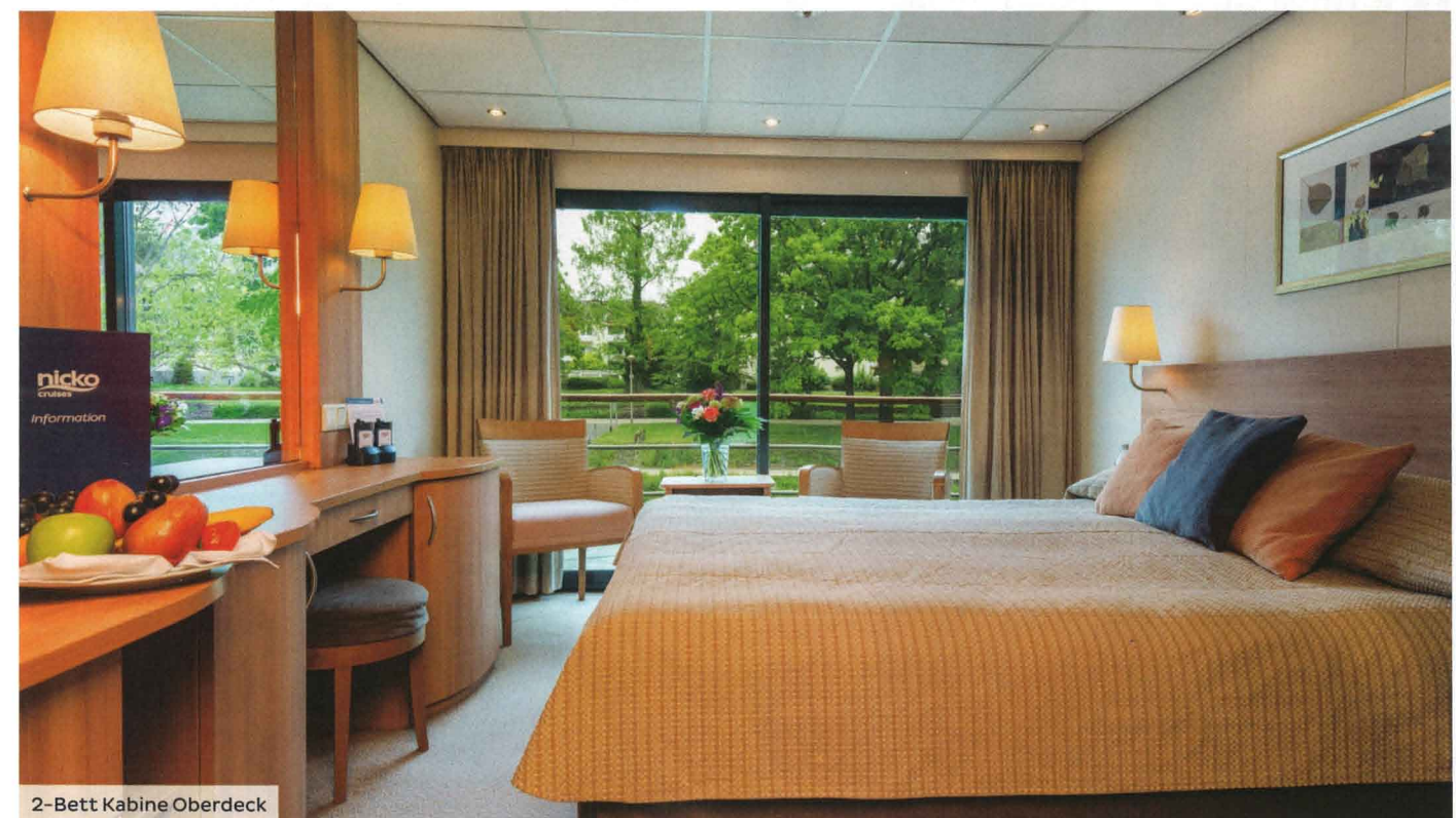
2-Bett Kabine Oberdeck

Modern und elegant unterwegs auf „Vater Rhein“ – auf unseren Schwesterschiffen MS RHEIN MELODIE und MS RHEIN SYMPHONIE erwarten Sie helle Räume und viel Platz für Ihre Traumflussreise. Die großflächigen Panoramafenster garantieren beste Aussichten auf die vorbeiziehende Uferlandschaft und das weitläufige Sonnendeck lädt zum Entspannen ein. In den großzügigen Kabinen tanken Sie Kraft für neue Entdeckungen entlang des großen Stroms. Im Panorama-Restaurant servieren wir Ihnen erlesene Spezialitäten, während die Bar im Panorama-Salon zu einem feinen Tropfen einlädt.