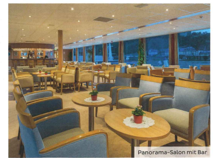
Panorama-Salon mit Bar