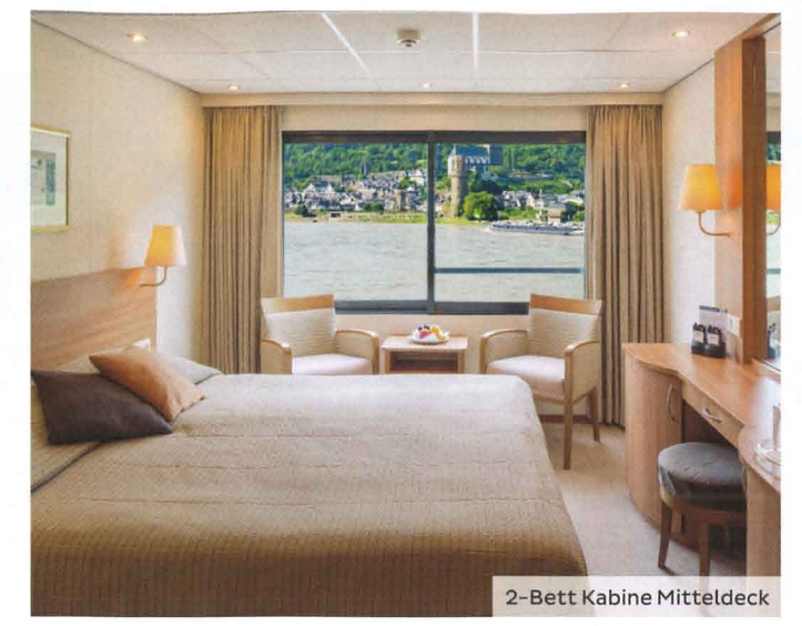
2-Bett Kabine Mitteldeck