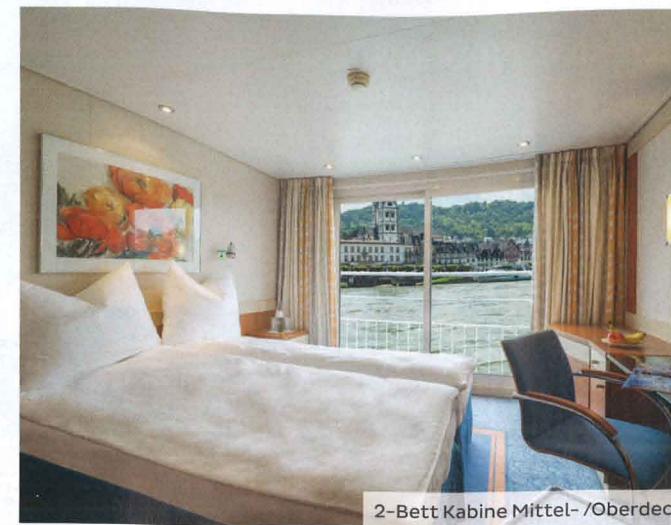
2-Bett Kabine Mittel- /Oberdeck