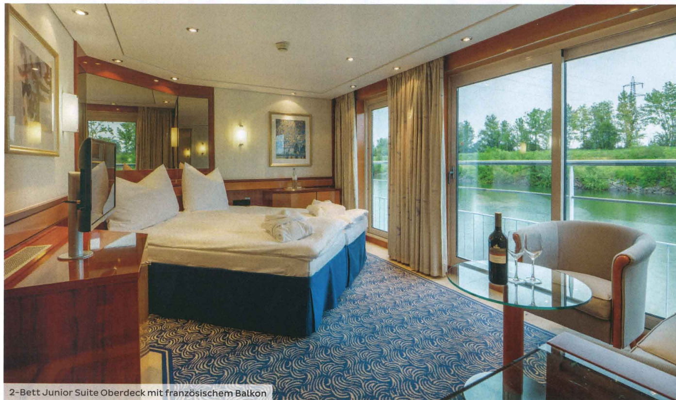
2-Bett Junior Suite Oberdeck mit französischem Balkon

Unsere MS BELVEDERE bietet beste Voraussetzungen für eine komfortable Flussreise. Erleben Sie an Bord in eleganter Atmosphäre die Schönheiten der Uferlandschaften entlang der Donau: Ob in bester Gesellschaft vom großzügigen Sonnendeck aus oder privat von Ihrer stilvoll eingerichteten Kabine. Das Schiff verfügt, anders als seine Schwesterschiffe, auch über 22 m 2 große Junior-Suiten. Genießen Sie entspannende Momente im Wellnessbereich mit Sauna sowie Gaumenfreuden im gemütlichen Restaurant.