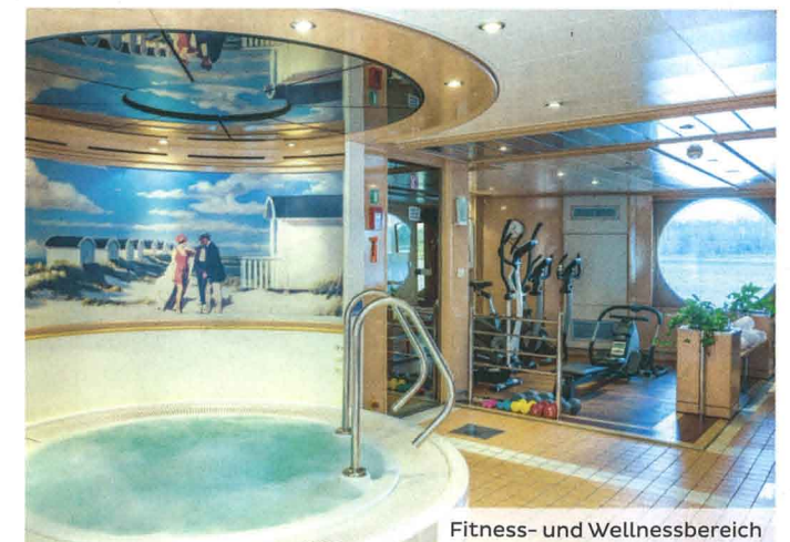
Fitness- und Wellnessbereich